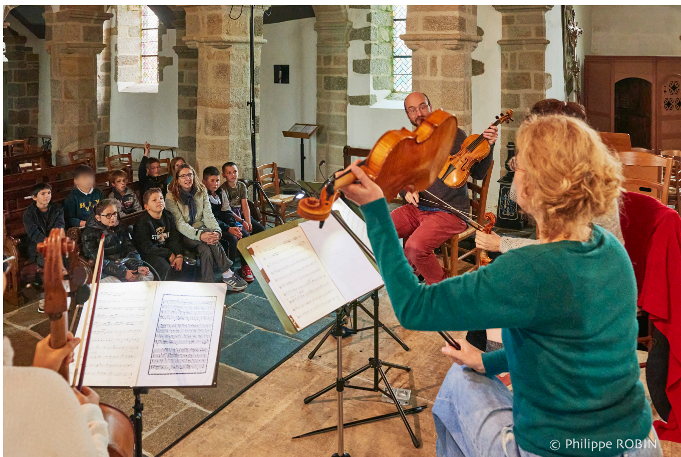
Rencontre entre la classe de CM2 de l'école de Plufur et les musiciens de l'ensemble les Récréations, la veille de leur concert au Festival de Lanvellec 2023.