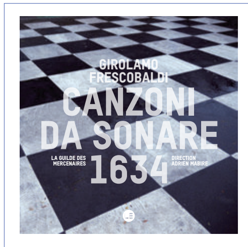
OPUS 6 > CANZONI DA SONARE, 1634 GIROLAMO FRESCOBALDI La Guilde des Mercenaires Adrien Mabire