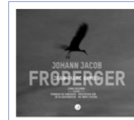
LIBRO SECONDO 1649 J. J. FROBERGER JEAN-MARC AYMES