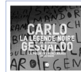
LA LÉGENDE NOIRE CARLO GESUALDO ADRIEN MABIRE LA GUILDE DES MERCENAIRES